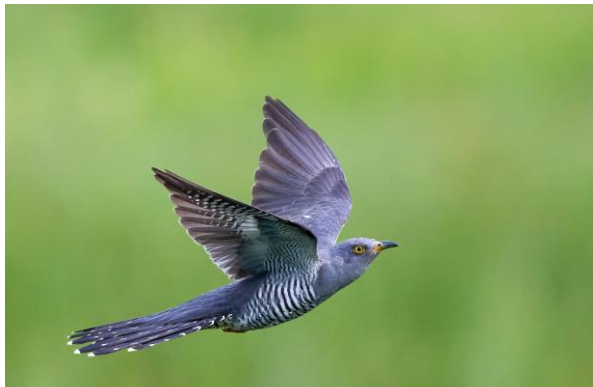
Kuckuck, Auried

Beginn der Hauptversammlung um 20.00 Uhr.